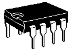
Корпус DIP-8 Типономинал K1224ПНЗР

Ближайшим функциональным аналогом является микросхема SP4412A фирмы "SIPEX".