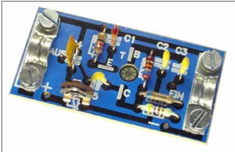
Общий вид набора

из журнала "Техника молодежи" по этому набору